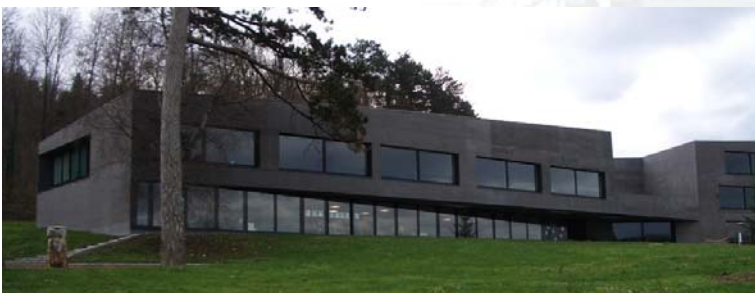
emploi de béton teinté dans la masse