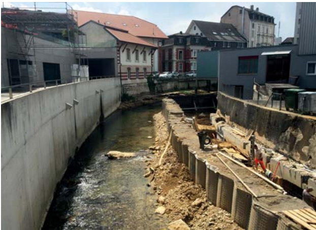
Projet 'Delémont marée basse' – lot centre aval.