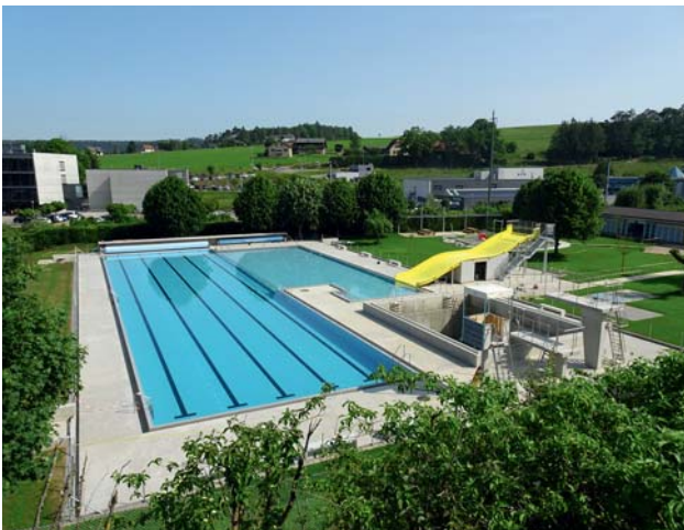
Réfection de la piscine à Porrentruy.