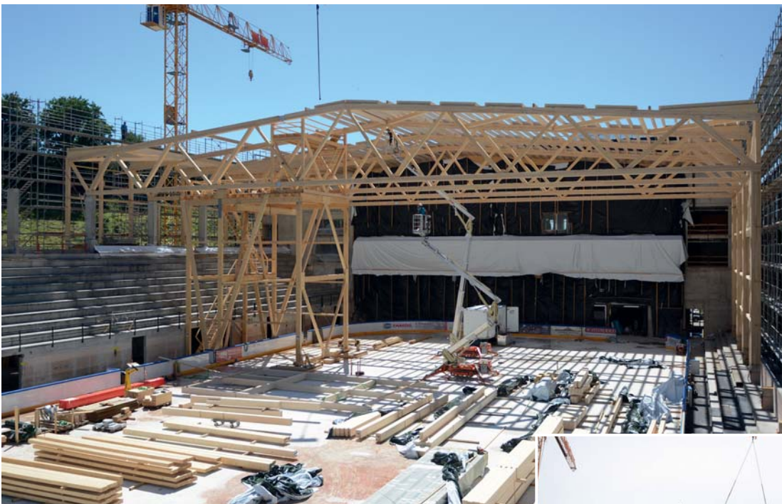
Réfection et 2 e champ de glace de la patinoire de Porrentruy.

travail s'est formé pour apporter les solutions les plus abouties. Buchs & Plumey a piloté l'entier du projet, géré les appels d'offre et dirige aujourd'hui les travaux qui obligent à un consensus permanent avec les riverains, lassés de ces nuisances qui sont maintenant à bout touchant. De plus, les travaux se sont trouvés ralentis par la découverte de vestiges archéologiques! Pour autant, au final, Saint-Ursanne va connaître un nouveau départ tout en gardant sa superbe.