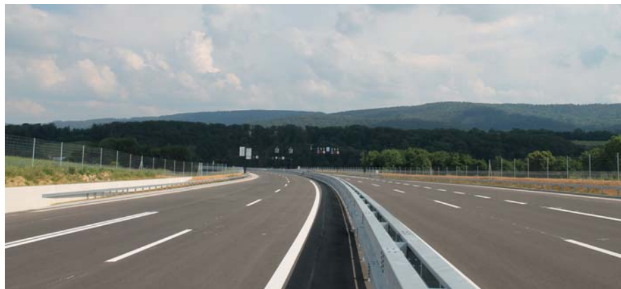
Autoroute A16-Section 2 – Tronçon tunnel de Bure – Viaduc du Creugenat.