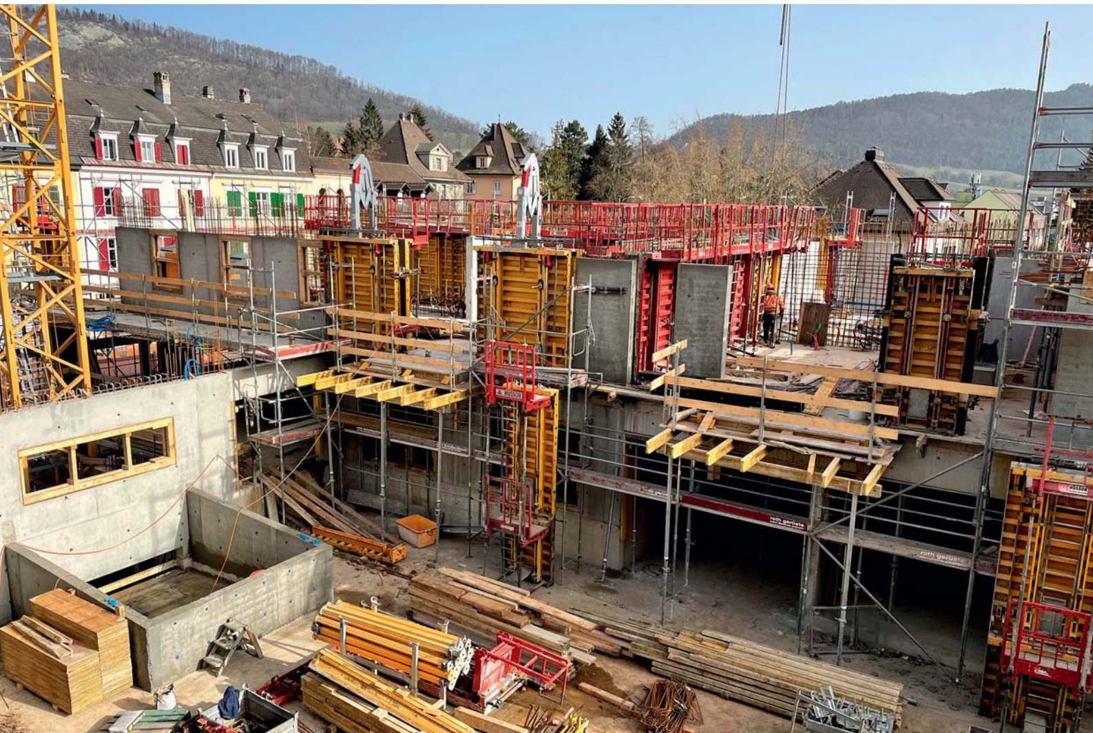
Centre commercial Le Ticle à Delémont.

Depuis sa création en 1979, le bureau d'ingénierie Buchs & Plumey SA, installé à Porrentruy, a toujours participé à des projets essentiels pour le Jura et l'Arc jurassien. Actif dans les domaines des structures, du génie civil, de l'aménagement du territoire et de la mobilité et transports, d'hier à aujourd'hui, il apporte sa pierre à l'édifice de réalisations marquantes et incontournables comme la Transjurane ou bien encore la nouvelle patinoire de Porrentruy.