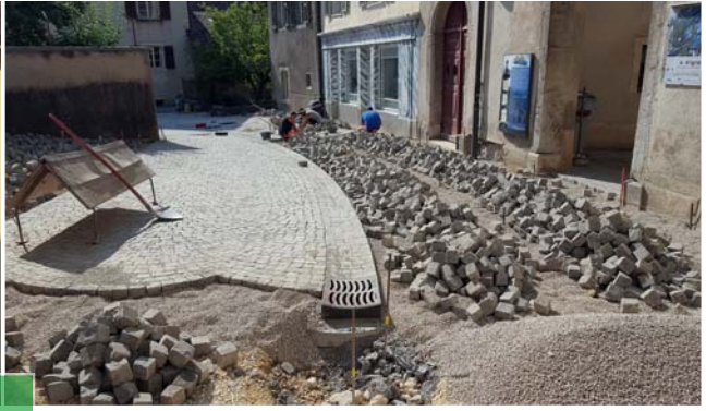
Réaménagement de la vieille ville de St-Ursanne.