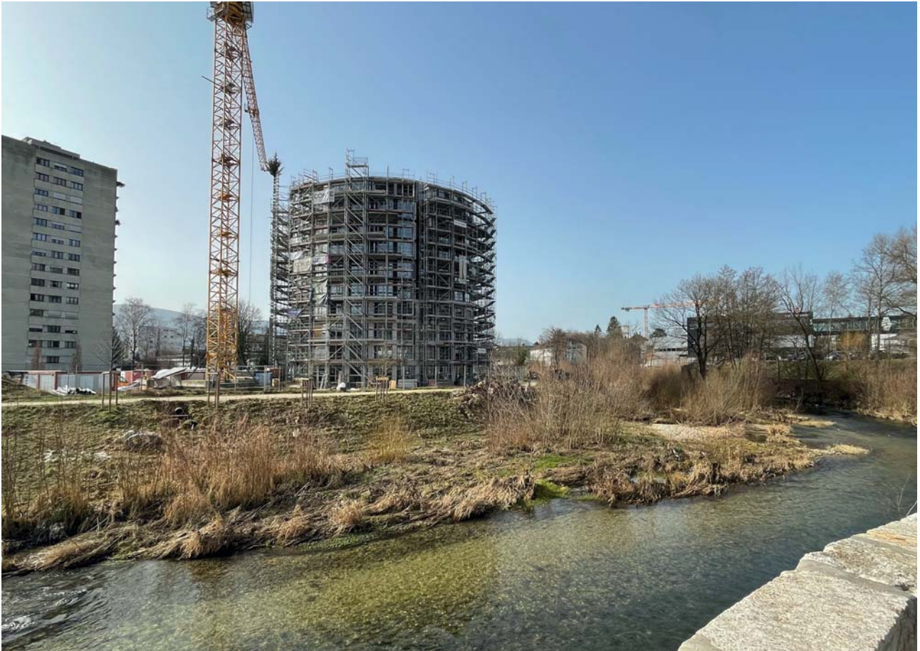
Résidence de la Sorne à Delémont.