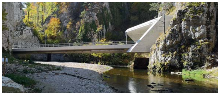
Pont RC6 à Choindiez.

Impossible de composer aujourd'hui sans la mobilité et les transports. Chaque projet de génie-civil est pour ainsi dire concerné. Pour répondre au plus juste aux besoins que cela engendre, Buchs & Plumey s'est entouré d'un ingénieur spécialisé qui y consacre une grande partie de son activité. Il collabore à des projets variés et sait conseiller, par ailleurs, au plus juste, les entreprises qui s'installent dans le Jura et qui doivent, dès 20 collaborateurs, établir un plan de mobilité.